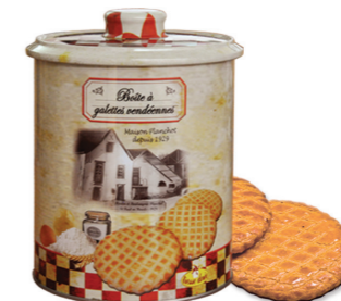
BOITE À GAULETTES VENDÉENNES au beurre et fleur de sel