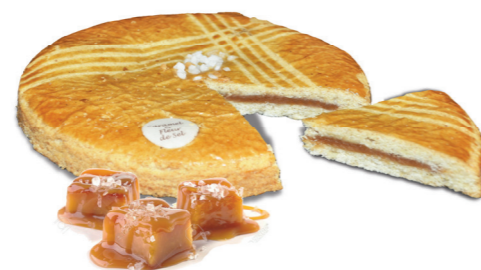
GALETTE CARAMEL Galette sablée fourrée au caramel fleur de sel