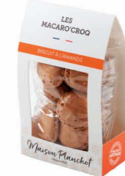
MACARO'CROQ Biscuit à l'amande