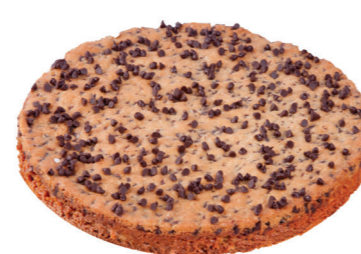
GALETTE COOKIE CARAMEL galette au coeur caramel