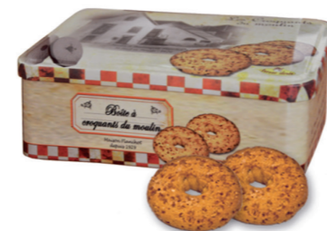
CROQUANTS DU MOULIN au caramel à la fleur de sel