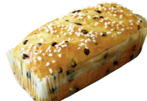
BRIOCHE AUX PÉPITES DE CHOCOLAT aux pépites de chocolat