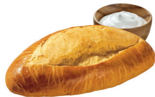
GÂCHE Brioche façonnée comme un pain à la crème fraîche