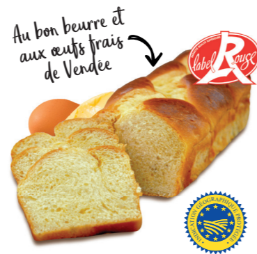
BRIOCHE VENDÉENNE LABEL ROUGE Indication Géographique Protégée