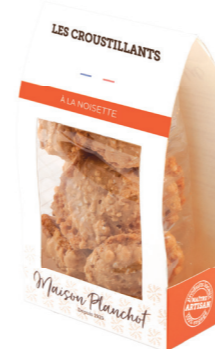
CROUSTILLANTS à la noisette