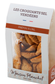
CROQUANTS'SEL VENDÉENS Façon préfou à l'ail